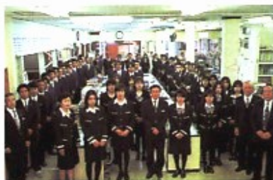
96名と営業所のイメージを覆す島田営業所

前でした。会社と製品そのものはずっと以前から知っていましたが、当初はポッシュ自身が、商品の売り方を迷っているイメージがありました。実際に取引をするきっかけになったのは、横浜のトレーニングに参加したこと。非常に丁寧に製品の事を教えてくれたことが印象に残っています。