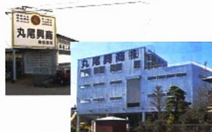
島田営業所が会社成長の原動力になった。いまま売上の約半分以上を島田営業所が占めている